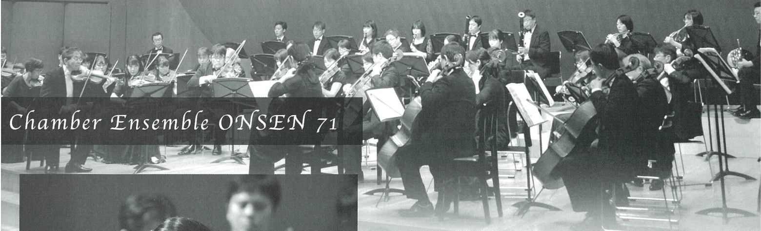
Chamber Ensemble ONSEN 71

特に2007年の第20回記念演奏会東京公演より開始した指揮者のいない2管編成オーケストラでの活動では、意欲的にレパートリーを展開し、ベートーヴェン：交響曲第5番「運命」を皮切りにモーツァルト：交響曲第41番「ジュピター」、ブラームス：交響曲第4番、ショスタコーヴィッチ：交響曲第5番、ハイドン：交響曲第104番「ロンドン」等に取り組み、さらにはソリストに三森未来子氏を招聘したドヴォルザーク：チェロ協奏曲、同じく館野泉氏による吉松隆：左手のためのピアノ協奏曲「ケフェウス・ノート」、天満敦子氏とのブルッフ：ヴァイオリン協奏曲、団員でもあるピアニスト岩波佳代子氏とのベートーヴェン：ピアノ協奏曲第1番等、その多彩なプログラムと活力溢れる演奏で好評を博している。